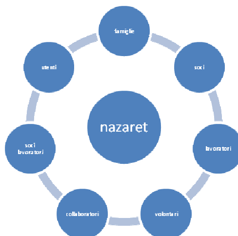
Portatori di interesse interni