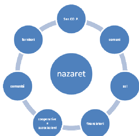
Portatori di interesse esterni